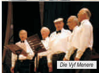
Die Vyf Menere